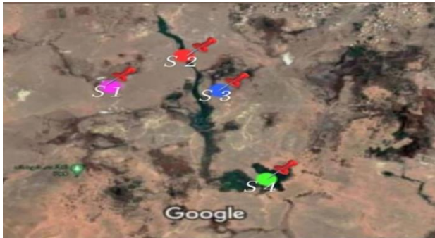
الشكل 2: توضح مواقع أخذ العينات من منطقة الدراسة.